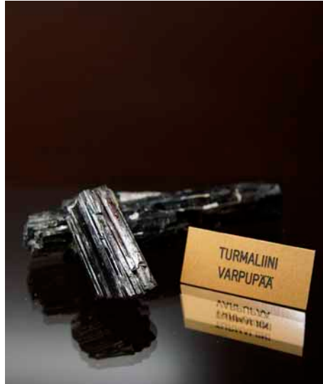
Härkäselän kivi- ja mineraalinäyttelyssä on paljon näytteitä paikallisista mineraaleista.