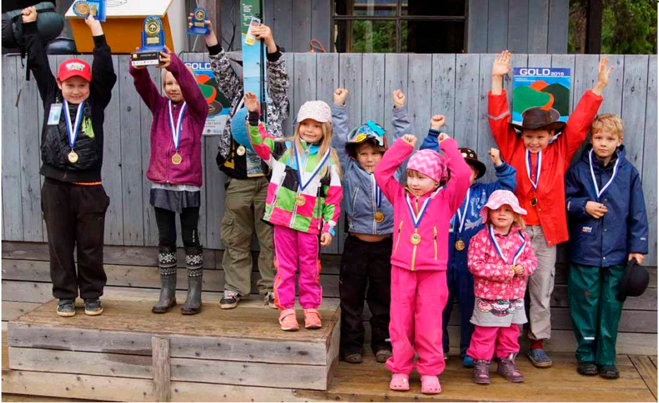
Yllä: Tulevaisuuden kullankaivajia palkintojen jaossa.