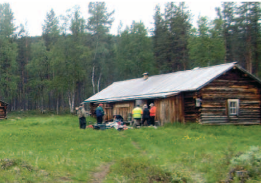
Tästä se alkaa! Ensin kampeet kasaan ja sisälle, sitten palaveria ja töihin.

Talkoot kestivät maastossa kolme päivää, takaisin tultiin torstain aikana. Näiden päivien aikana saatiin tehtyä monta asiaa. Aikaa vievintä oli Ritakosken pihapiirin kaikkien rakennusten kattojen puhdistus ja tervaaminen – Metsähallituksen huoltotupaa lukuun ottamatta. Vajaan kilometrin alavirran suuntaan sijaitsevan Kivekkään höyrykoneen katoksen katto oli hyvässä kunnossa ja pelkkä puhdistaminen riitti. Ylävirran suunnassa sijaitseva Liljeqvistin ruoppaaja puolestaan harjattiin puhtaaksi mm. siihen kertyneistä irtolehdistä ja – neulasista.