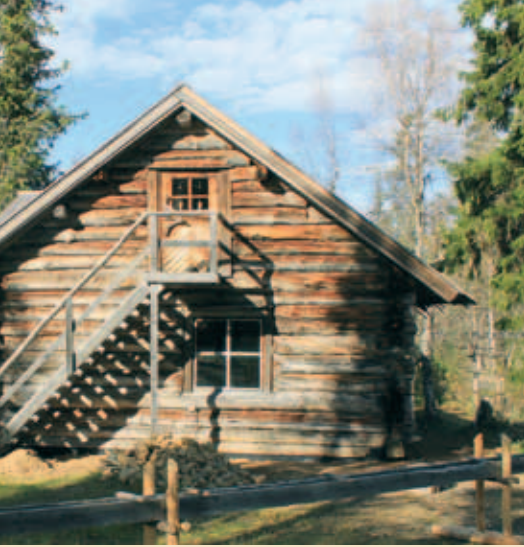
Härkäselkä iltapäiväauringossa, patosuoja alkaa olla paikoillaan.