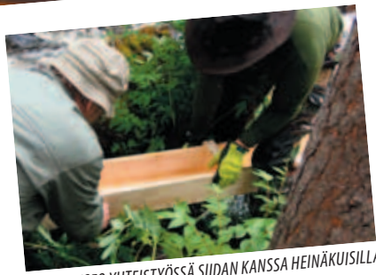
KULTAMUSEO YHTEISTYÖSSÄ SIIDAN KANSSA HEINÄKUUISILLA INARIVIICOILLA s. 9