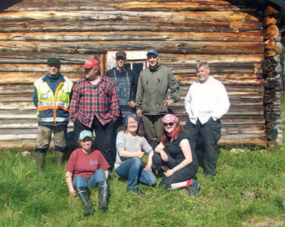
Me teimme sen! Ennen Ritakoskelta lähtöä ehdittiin vielä yhteiskuvaan.

Työntäyteisten päivien jälkeen varattiin aikaa myös telttasaunan lämmittämiseen. Sauna tarjosi alkuillasta makeat lölyt ja Ivalojoki hyvät peseytymisvedet. Ritakosken talkooleirillä on yhdeksi iltaperinteeksi muodostunut lähtyen paisto nuotiolla eikä siitä poikettu tälläkään kertaa.