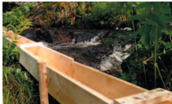
Yksi ränni on aseteltu paikoilleen ja vesi virtaa vauhdilla rännin pohjalla.

myös opastamassa ulkomuseopäivänä vierailijoita kullanhuuhtonnan saloihin. ●