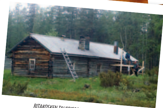
RITAKOSKEN TALKOISSA TUOKSUI TERVA s. 16