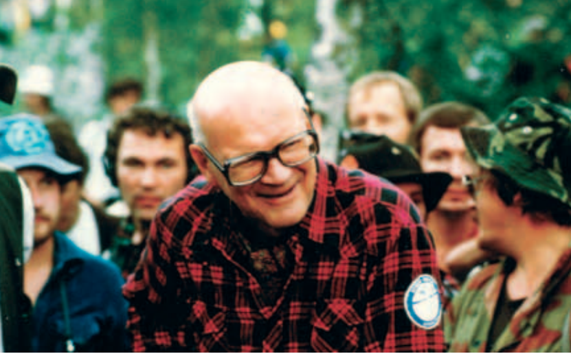
Valtakunnan päämieheltä liikeni Härkäselän näyttelyrakennuksen peruskiven muurauksen jälkeen myös hymyä yleisölle.

T ankavaarassa järjestetään ruska-aikaan elokuussa ja syyskuussa ns. Kekkonen kierros, ”Kekkonen – Kai-rankulkija”. Kultamuseo on kierroksella mukana omalta osaltaan Kekkonen vierailusta kertovalla pop-up tyyliisellä näyttelyllään.