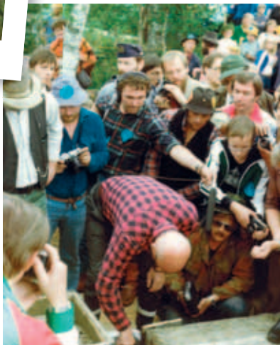
KEKKONEN POP-UPINA MUSEOLLA SYKSYLLÄ s. 5