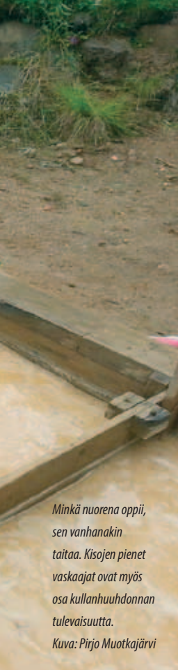
Minkä nuorena oppii, sen vanhanakin taitaa. Kisojen pienet vaskaajat ovat myös osa kullanhuuhtonnan tulevaisuutta.