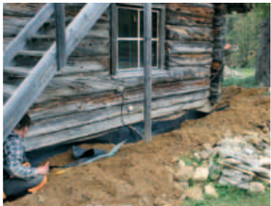
PELASTAKAA HÄRKÄSELKÄ! -KAMPANJA ON AVATTU s. 15