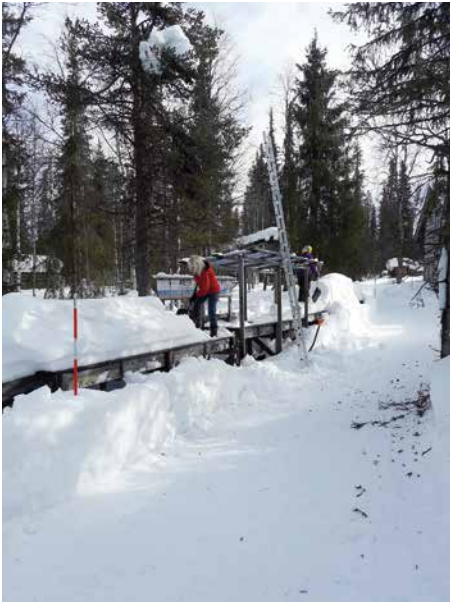
Kultamuseon talvitalkoissa ollaan jo nimen mukaisesti jollain tapaa lumen kanssa tekemisissä.