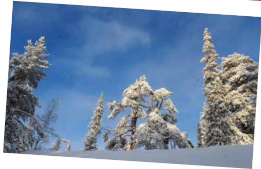
TALVEN AUKIOLOAJAT s. 6