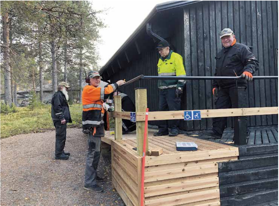
Syystalkoiden päätteeksi korvattiin vielä invarampin ylin väliaikainen kaide sopivammalla.

GW:n ja Hoikan kämpän kattojen sekä korkeiden rännien puhdistusta. Sisätiloissa hommina olivat esimerkiksi perusnäyttelytilan rännivitriinin lampujen vaihto ja ikkunoiden