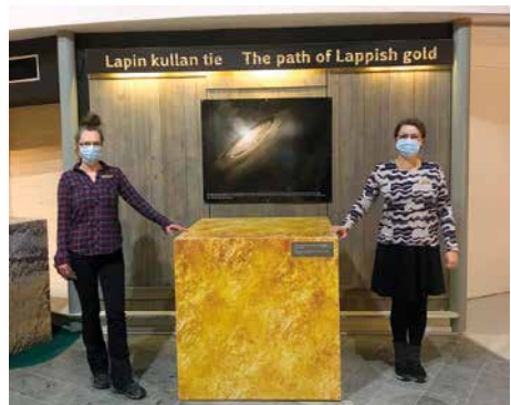
Hyvä etäisyysmittari näin epävarmoina aikoina on kultakuutio.