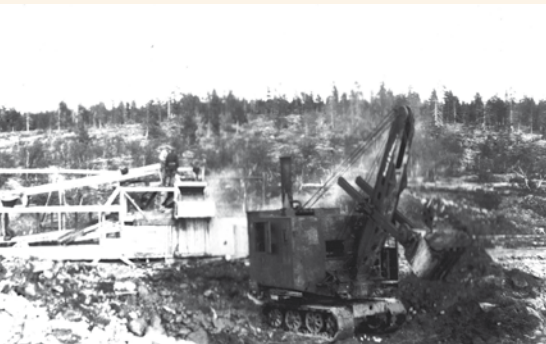
”Hullu-Jussi” lempinimen saanut kaivinkone Ivalojoen Oy:n kaivosalueella Kuivakurulla, Inarin Laanilassa 1920-luvulla.

1920-luvun alkaessa oli maamme juuri muutama vuosi aiemmin itsenäistynyt ja opeteltiin elämään uudessa omassa valtiossa, sen sääntöjen ja lakien mukaan. Tähän liittyen tuolla vuosikymmenellä tuotiin ensimmäiset kaivinkoneet Lapin kultamaille. Esimerkiksi Oy Ivalojoen Ab tilasi höyrylapion Ivalojoen Kuivakurun työmaalle vuonna 1925. Lempinimellä ”Hullu-Jussi” kulkenutta höyrylapiota koekäytettiin kesäkuussa 1926, mutta se meni tuon tuostakin rikki. Taisi käydä niin, ettei höyrylappio edes ansainnut hintaansa takaisin.