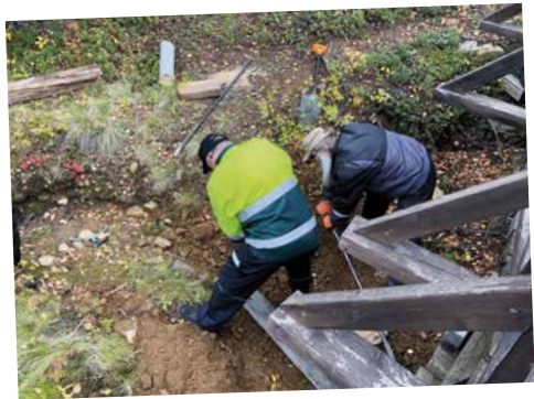
Hopiaojan yli vievän sillan tukemisessa tarvittiin suunnittelun lisäksi myös yhteistyötä.