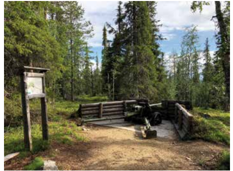
Sotamuseolta Kultamuseolle deponoitu panssaritorjuntakanuuna on ollut vuodesta 2013 lähtien osa sotahistoriallista polkua Tankavaarassa.