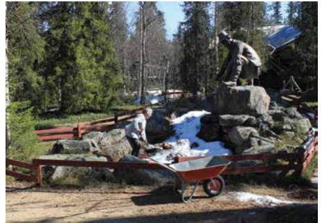
Kesätalkoisiin mennessä lumet ovat suurelta osin sulaneet, joten ulkoalueella pääsee tekemään siistimistöitä kesäkautta varten.

Kesän alussa on tarkoitus järjestää talkoot, joiden tehtävälistaus lienee varsin samankaltainen aiempaan verrattuna eli ulkoalueen järjesteleminen kesäkuuntoon sekä alueen siistiminen talven jäljiltä. Lisäksi on jokunen pienempi homma, joita syystalkoissa ei ehditty tai olosuhteiden vuoksi voitu toteuttaa. Keljun kelin sattuessa kohdalle riittää sisätiloissakin jonkin verran puuhaa.