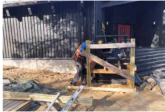
Kultamuseon uuden invarampin työt hyvässä vauhdissa.

Museolla on aiemminkin ollut pieni invaluiska Golden World-rakennuksen takasisäänkäynnin yhteydessä, mutta se on kymmenien