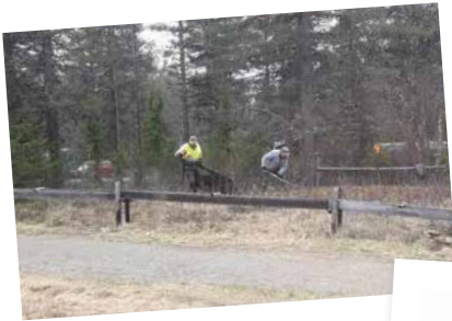
TULEVAT TALKOOT s. 9