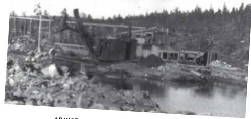
ARKISTOISTA - VUOSISATA SITTEN s. 14