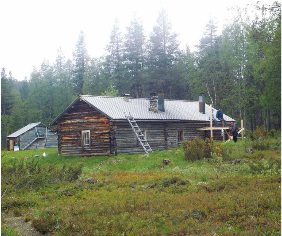
Erämaisesta sijainnistaan huolimatta Ritakosken kultala ympäristöineen on toiminut aikoinaan niin yksityisten kuin yhtiöidenkin tukikohtana.