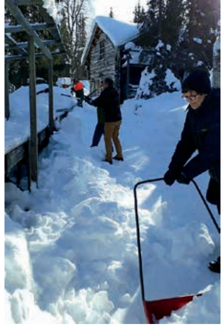
Huuhdonta-altaiden lumihuput saivat kyytiä poutaisessa kevättalven säässä.

M useon kevättalkoot järjestettiin jo muutaman vuoden perinteen mukaan pääsiäisen tienoilla. Ulkopainotteiseksi menivät työt suurlta osin, sillä talven lumikuormaa piti alkaa helpottamaan eri ulkoalueen rakennelmien ja rakennusten katoilta ympäri ulkomuseoaluetta. Esimerkiksi kesäkahvilarakennus ja ulkojuhondonta-altaat olivat keränneet päälleen komeat lumikeot. ●