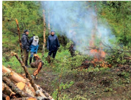
Lemmenjoella elokuinen (2017) keli oli märkä, samoin maa. Mutta kun tarpeeksi hyvä hiillos oli jäljellä, saatiin oksanpätkiä ja latvuksia varten varatulla polttopaikalla nuotio liekkeihin. Etuvasemmalla näkyy pieni osa käyttökelpoisempien runkojen yhdestä pinosta.

T ämän lehden viimeisten juttujen kirjoittamisen aikoihin on osa Kultamuseon työntekijöistä sekä vapaaehtoiset Lemmenjoen Morgamojalla talkoissa. Kultamuseon ja Metsähallituksen yhteistyönä järjestetään Morgamojan Kultalan ympäristössä vielä yksi talkooleiri liittyen Lemmenjoen kultareitti-hankkeeseen. Teemana on edellisvuotiseen tapaan ympäristönhoitotyöt eli arkisemmin ilmaistuna ylimääräisen risukon ja puuston raivaus. ●