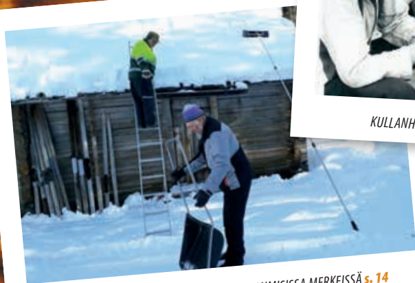
MAALISKUISET KEVÄTTALKOOT SUJUIVAT LUMISSA MERKEISSÄ s. 14