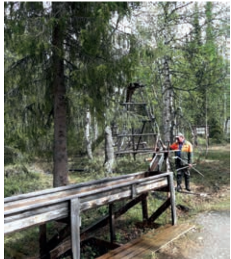
Kyllä, siellä se vesi virtaa taas huuhdonta-altaissa! Pieni falskaaminen ei alussa häitää mitään.

K esän alku oli hieman viimevuotista suosioilisempi ja suurimmasta osasta lumia oli pääsy eroon jo toukokuun loppuun mennessä. Niinpä samaan aikaan museon kesäaukioloon siirtymisen yhteydessä oli hyvä järjestää talkoot museon alueella. Siistimistä ja järjestelyä ulkoalueella olikin, sillä humahduksessa sulaneet lumet paljastivat talven aikana kertyneet risut ja oksanpätäkät, huonokuntoiset aitaosuudet jne. Samoin Nurminen karrättiin Mutterikämpään kesäteloilleen istumaan ja olemaan yleisölle näytteillä. Vesiasiat huollettiin kuntoon – nyt passaa huuhdonta-altaissa jälleen kokeilla onneaan ja Vaskaajapatsaan vaskoolista lirisee iloinen puro alapuoliseen altaaseen. ●