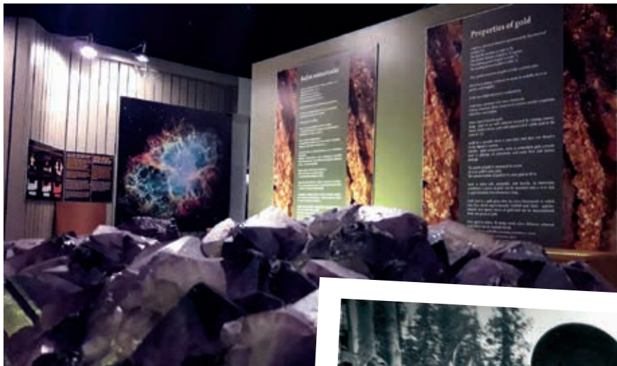
KIVET JA MINERAALIT YLÄ-LAPIN HISTORIASSA-PROJEKTI s. 15