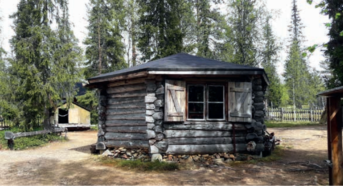
Ulkomuseoalueella sijaitseva Mutterikämpä avattiin jälleen kesäkaudeksi yleisölle.

on touhua vaikea ymmärtää. Kun puiston "pääopastuskeskusta" suunniteltiin, suorittivat suunnittelijat liikennelaskelmia, joissa todettiin Tankavaaran kävijämäärä riittäväksi myös uudelle infokeskukselle. Rakennettiin henkilökunnan asuntoja ja lisäksi kaksi ensimmäistä puistonjohtajaa asui paikkakunnalla. Sittemmin johto etääntyi etätöiden myötä ja suora yhteys puistoon ja ympäristöön muuttui.