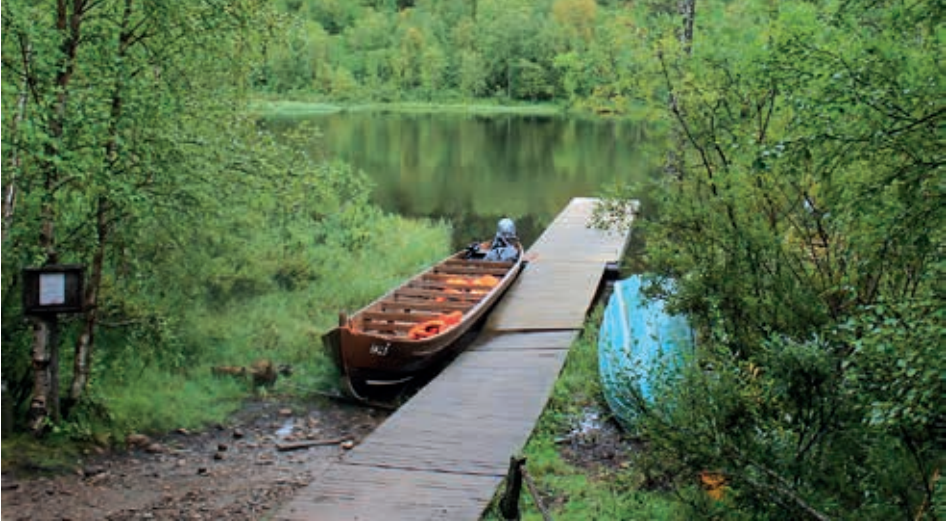
Kultahaminasta lähdetään Morgamojalle Lemmenjoen kultareitin avajaisen viettoon.