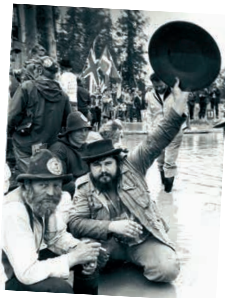
KULLANHUUHDONNAN SM-KISAT s. 18