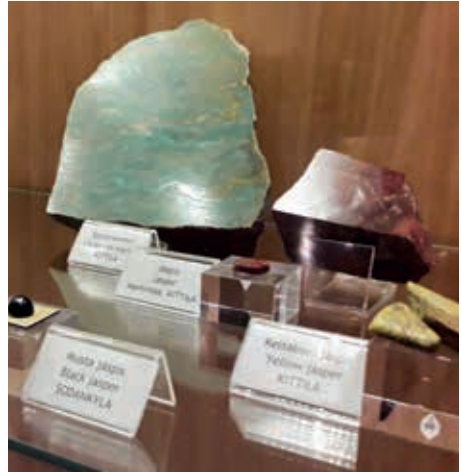
Härkäselän rakennuksen ollessa vielä remontin alla löytyy väliaikainen kivi- ja mineraalinäyttely kansainvälisen puolen eli Golden World-rakennuksen alusta. Väliaikaisessa näyttelyssäkin olevat kivet ja mineraalit ovat käyneet jo järjestelyprosessin läpi.

Näyttelyn tilasuunnitelmat tehtiin kuhun- kin kerrokseen eri näkökulmia noudattaen,