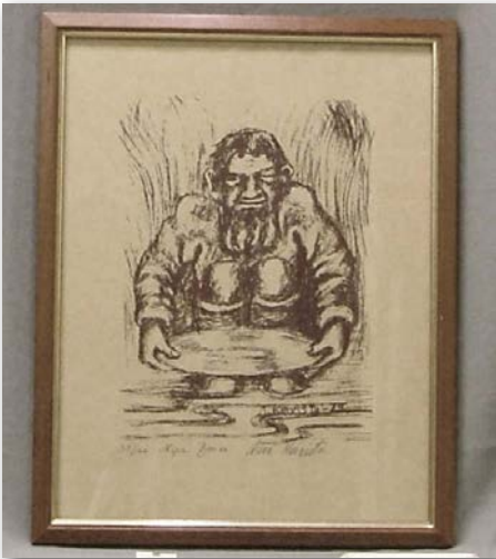
Saapa nähdä, löytyykö näyttelystä myös tämä Arvo Koiviston grafiikkatyö? Se selviää kesällä 2026.

Kausityöntekijät tekivät omat poimintansa ennen sesongin loppua, vakiporukka tekee valintansa talven aikana.