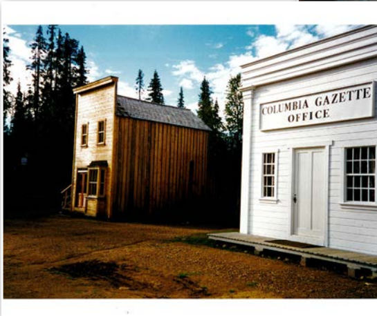
Kuva yllä: Aurarian ulkoaluetta rakennus- ja pystytysvaiheessa. Vasemmalla oleva Bodie Hotel on saanut katon päälleen, ulkopinnoitus puuttuu vielä. Oikealla oleva Columbia Gazette Office on lopullisessa ulkoasussaan. Oikealle puolelle jää vielä pari muuta rakennuskopiota.