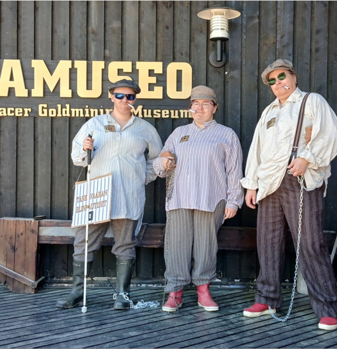
Tankavaaran elinkautiset – Kultamuseon joukkue kesän 2025 kultakisoissa. Kyseessä on ns. Lapin kulta-sarja, joka on huumorimielinen haastekisa erilaisille yhteistyötahoille.